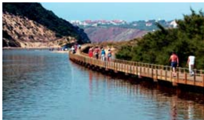
Passadiço de S. Martinho do Porto