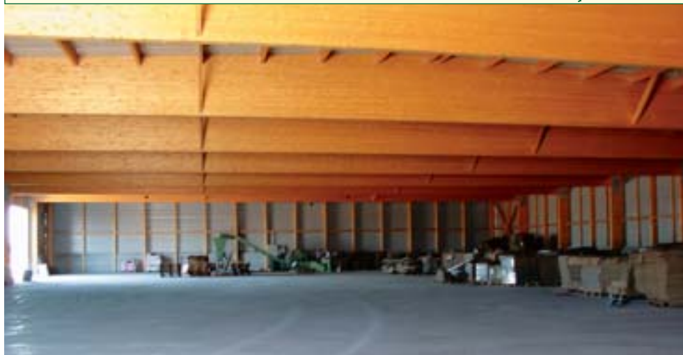
Pavilhão Industrial A. Milne Carmo S.A.

No final de 2005 a Carmo Estruturas iniciou a sua actividade no mercado das estruturas em madeira lamelada colada, tendo desde então procurado alargar a sua oferta e conquistando cada vez mais a confiança dos seus clientes.